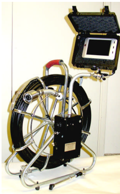
VMR 5060 med LCD-skärm.

Detta är en rörinspektionskamera avsedd för filmning av rör med dimensionerna från 75 till ca 300 mm. Kameran är utrustad med en gyrofunktion som gör att bilden alltid visas rättvänd oberoende av kamerans position i röret. Denna kamera tillverkar vi på Vretmaskin själva och bedriver en kontinuerlig utveckling av tack vare dialog med våra kunder. Vi kan därför garantera att du som väljer en VMR 5060 gyrokamera alltid kommer att få en modern kamera byggd för skandinaviska förhållanden!